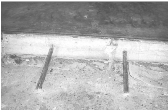
Эта ступенька между старым и новым полом должна стать ступенью к НОВОЙ КУЛЬТУРЕ ПРОИЗВОДСТВА

В своем предыдущем номере, посвященном культуре производства на нашем предприятии, "Контакт" обратился с рядом вопросов к работникам Бизнес-единицы "ЭИМиП". Напомню, мы вкладываем немалые средства в обновление фондов. Например, на токарном участке "ЭИМиП" проведена замена старых полов на новые и современные, создана новая система энергоснабжения. На реконструкцию одного только этого участка мы потратили около 1 миллиона рублей.