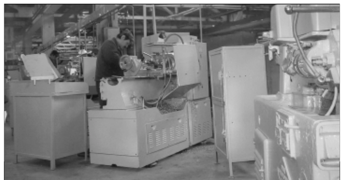
Станины станков своевременно смазываются, мусор собирается в специальные емкости