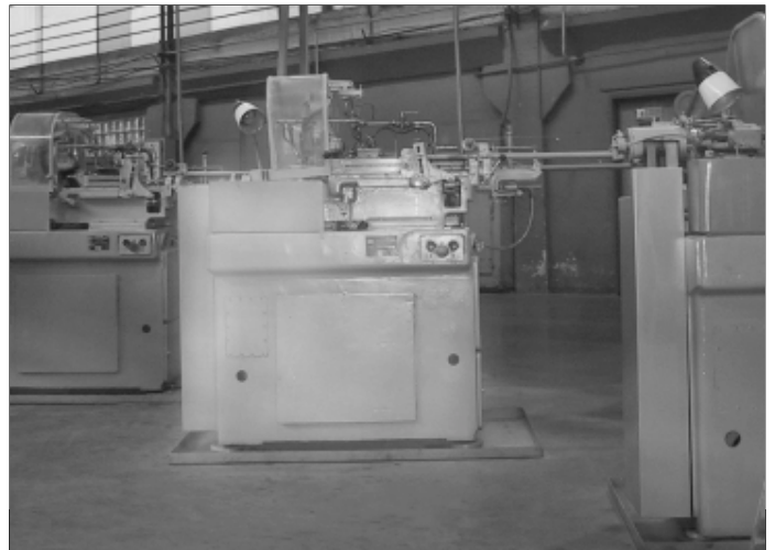
Станки и элементы верхней разводки энергоснабжения покрашены, свалки ликвидированы, рабочие места прибраны

Ободранные ранее станки покрашены, рабочие места своевременно прибираются, станины смазаны, стружка и мусор — в специальных емкостях, заготовки где попало не валяются. Покрашены элементы верхней разводки энергоснабжения, свалки ликвидированы.