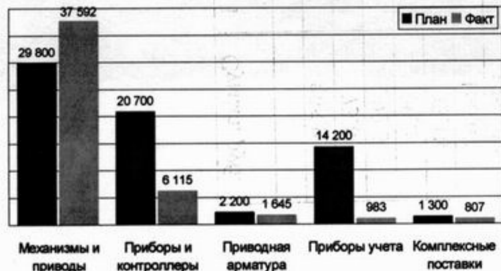
Поступление денег за готовую продукцию по продуктовым направлениям, тыс.руб.

Наилучшие результаты выполнения плана в сентябре показали продавцы: