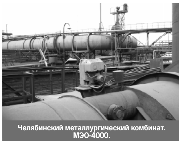
Челябинский металлургический комбинат. МЭО-4000.

ЗЭиМ имеет репутацию поставщика надежного оборудования. Высокое качество продукции подтверждается ее длительной и безотказной эксплуатацией на предприятиях тепловой и атомной энергетики, нефтехимии, металлургии и других отраслей. Среди клиентов Компании крупнейшие предприятия России: РАО «ЕЭС России», Газпром, Лукойл, Северсталь, Сибнефть.