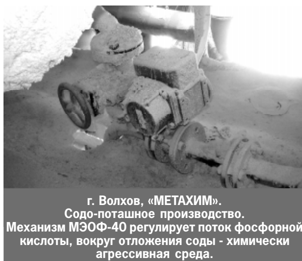
г. Волхов, «МЕТАХИМ». Содо-поташное производство. Механизм МЭОФ-40 регулирует поток фосфорной кислоты, вокруг отложения соды - химически агрессивная среда.

Механизм МЭО-4000 установлен на открытой площадке на высоте 15 м. Работает в экстремальных условиях: выдерживает сильную вибрацию, перепады температур.