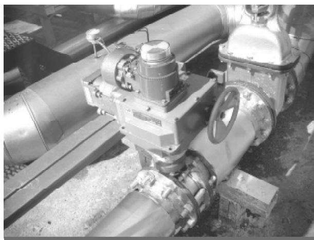
НГДУ «Бавлынефть», ОАО «Татнефть», г. Бавлы

Изготовление и реализация механизмов и приводов - результат труда многих сотрудников завода: рабочего, инженера, конструктора, менеджера. Где и в каких условиях работают наши механизмы на объектах, могут видеть не все. Введенные в эксплуатацию механизмы фотографируют выезжающие в командировки сотрудники отдела продаж, некоторые фото приведены ниже.