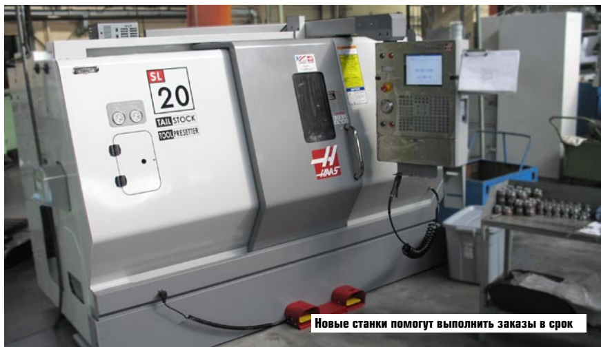
Новые станки помогут выполнить заказы в срок

- В настоящее время на предприятии проводится анализ, определяющий позиции, по которым часть деталей будет передаваться на аутсорсинг (производство несложных деталей на «чужих» производствах). Уже пошел процесс перевода стандартизованного крепежа от производства к закупкам. Кроме того, Инженерный центр ОАО «ЗЭИМ» работает в направлении снижения трудоемкости изготовления деталей и узлов.